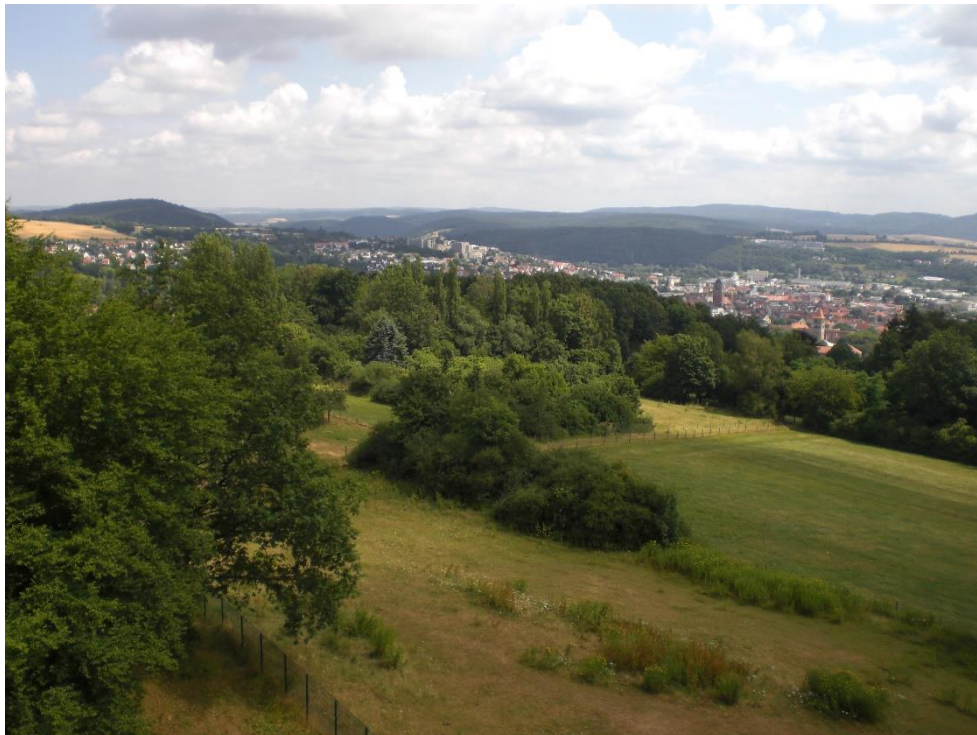
Blick auf die Kleingärten und ihre Umgebung aus südwestlicher Richtung.

Bei dem beplanten Gebiet handelt es sich um Kleingärten mit laubenartiger Bebauung. In der Gartenparzelle der Pfadfindergruppe befinden sich ältere Streuobstbestände auf Grünland. Die östliche Parzelle wird im Landschaftsplan der Kreisstadt Bad Hersfeld als Fläche mit Gebüsch/Hecken/Feldgehölzen auf frischem Standort mit überwiegend standortgerechten Arten dargestellt. Nördlich grenzt ein Rad- und Wanderweg an den Geltungsbereich. Die umliegenden Flächen werden überwiegend landwirtschaftlich genutzt. Der Bereich liegt überdies in der engeren Schutzzone des Heilquellenschutzgebietes der Stadt Bad Hersfeld.