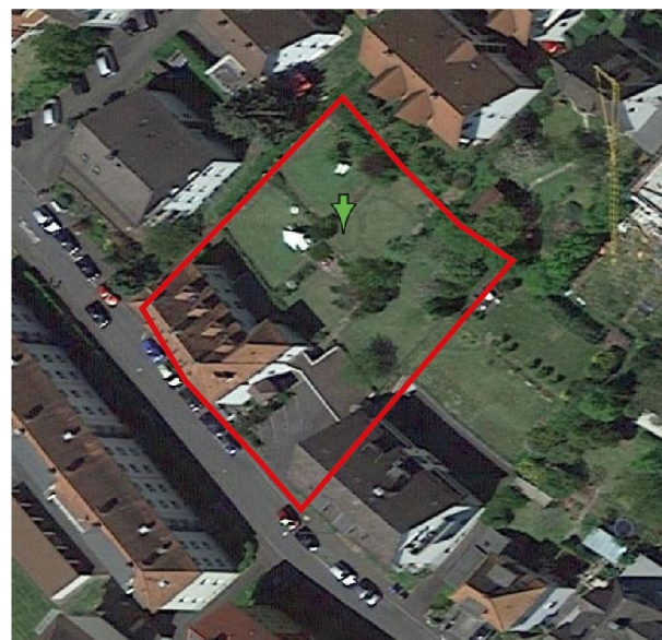
Abbildung 1: Bestandsbebauung Vlängenweg 31 und 33

Die vorhandene Bebauung soll zurückgebaut werden und durch einen Gebäudekomplex mit Einzimmerwohnungen ersetzt werden. Die notwendigen Stellplätze sollen in einer Tiefgarage untergebracht werden. Der Lageplan sowie ein Schnitt der Bebauung können den Anlagen 1 und 2 entnommen werden.